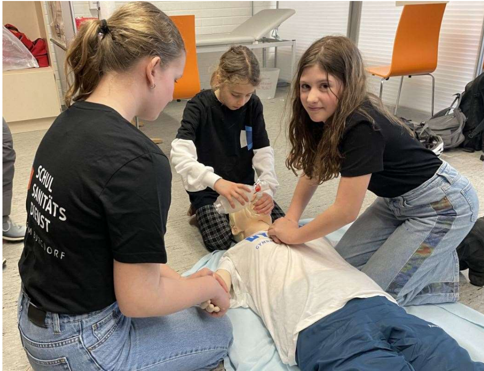
Die Trainings-Puppe im Einsatz mit Schülerinnen der Sanitäts-AG