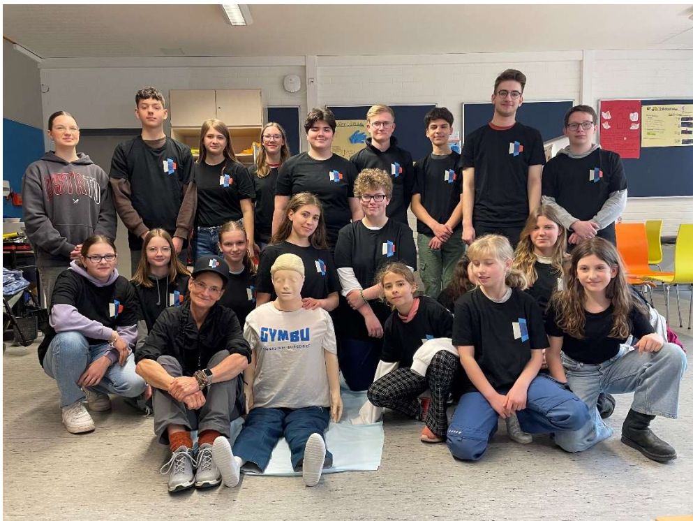
Ein starkes Team: Die Mitglieder der Sanitäts-AG sagen „Dankeschön“ für diese Spende.