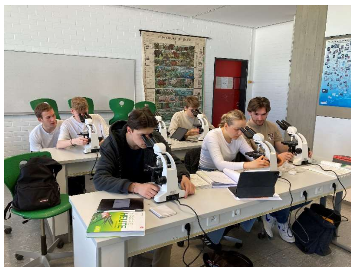
Die neuen Mikroskope im Einsatz im Biologieunterricht