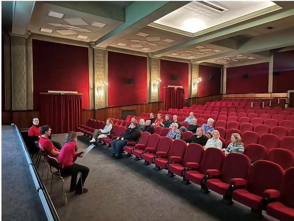
Mitgliederversammlung im Kinosaal – mal etwas anderes