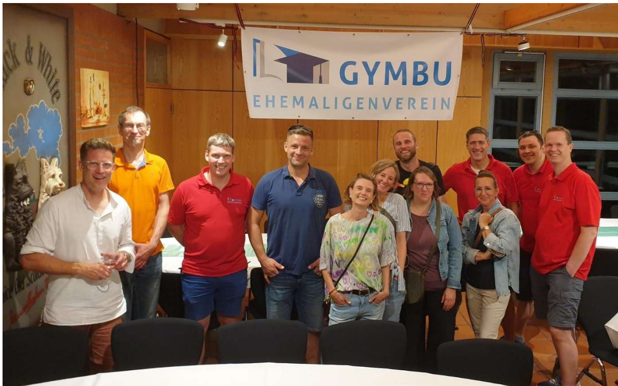
Der harte Kern der Teilnehmer des Ehemaligentreffens – gut gelaunt nach Mitternacht

„Wir machen das weiter, solange einige kommen, die uns eine positive Resonanz geben!“