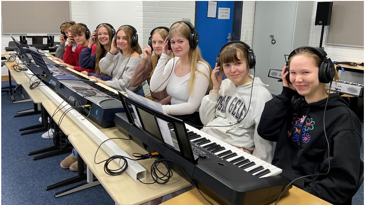
Die neuen Kopfhörer beim Einsatz im Musik-Unterricht